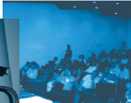
Mais de 200 pessoas discutiram os modelos jurídicos dos institutos de pesquisa

Plonski afirmou ainda que a empresa pública é dependente em relação aos recursos, que são estabelecidos pela Lei Estadual Orçamentária e, assim, está sujeita à Lei de Responsabilidade Fiscal. Segundo o diretor, se o limite de comprometimento dos recursos estiver na faixa de risco, por conta da folha estadual de pagamento, o IPT pode sofrer com a redução dos recursos.